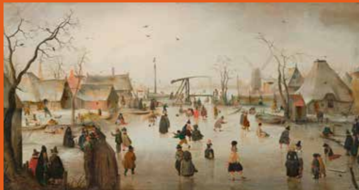
Dit schilderij is 400 jaar oud. Wat zie jij de mensen op het ijs doen? Schrijf drie dingen op!

Nederland is een echt schaatsland. Als het flink heeft gevoren en het ijs dik en sterk is, zie je buiten overal mensen schaatsen. En anders gaan mensen in de winter naar ijsbanen. Want dat is ook leuk!